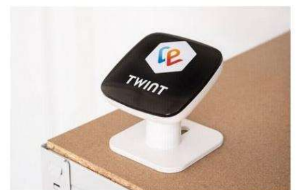
Kasse mit Beacon