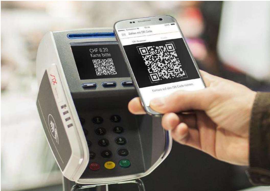
19.10.2021 Seniorenrat Brugg